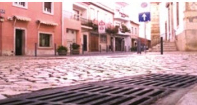
Trabalhos de limpeza de sumidouros e sarjetas nos arruamentos da Freguesia