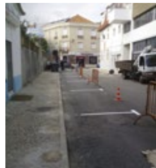
Marcação de lugares de estacionamento na Rua dos Bombeiros Voluntários