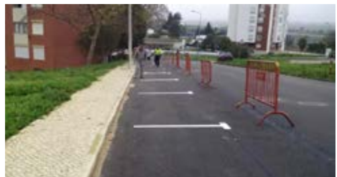
Pintura de lugares de estacionamento na Rua Júlia Van Zeller Pereira Palha (Povos)