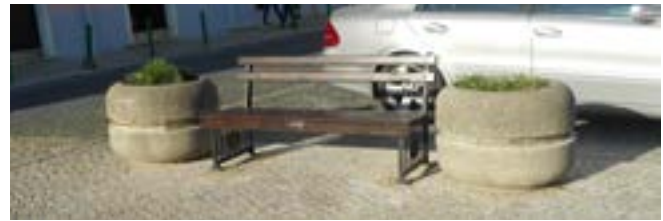
Recuperação de mobiliário urbano em diversos arruamentos da freguesia nomeadamente na rua 27 de Maio, Rua 16 de Março e Rua Manuel Afonso de Carvalho (centro de VFX)