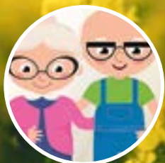
Passeio dos Avós ao EVOA